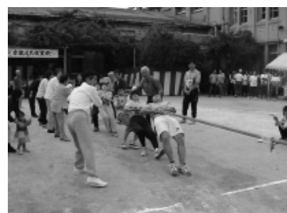
区民運動会 体育振興会