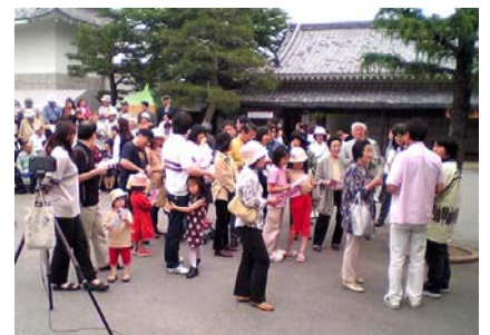
東映太秦映画村探訪

参加人数制限無しで、大人29名・子供8名。全員徒歩で京福電車大宮駅へ…。まさに「遠足っ!」といった感じでワイワイガヤガヤ。電車