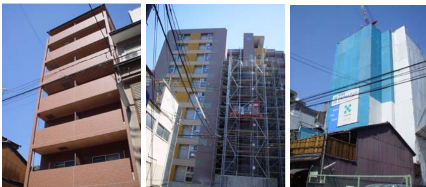
左から藤西町の学生マンション、空也町・藤本町に建設中のマンション