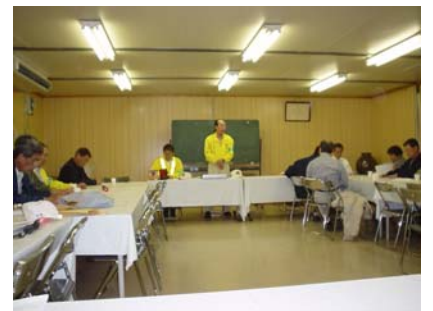
新発足した本能自主防犯会の総会

4月21日、第1回総会が開かれ、自主防犯会が発足しました。各町内より選出された防犯委員(防災委員を兼ねる)と五条署から委嘱された防犯推進委員からなる組織で、明るい本能学区・美しい本能学区・住民間の交流ある本能学区をめざして活動します。この日は、3グループに分かれ、3つに分割した学区の一区画をパトロールしました。1年に3回このパトロールを行い、1年で、全員が学区内をくまなく見て回るようになります。夜間の学区内には、所々電球切れの外灯があったり、先日防犯会議が開かれた直後に空き巣が侵入したという現場を見たりして、照明の少ない夜道やガレージの危険を感じました。各お宅が終夜門灯を点けておいていただけると、随分明るくなります。ご協力をお願いします。