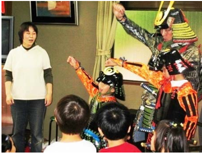
エイエイオー!! 総大将の出発