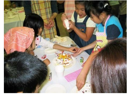
デコレーションケーキの完成

今年は「こどもの日ー武者装束とケーキづくり」。まず、本能自治会館2階の和室で、映画小道具の高津商会(太秦映画村のすぐ傍にあります)の方による、戦国時代の胴丸といわれる鎧兜一式の装束の解説と着付けです。大きい五月人形のように、あらかじめ飾り付けられていた鎧兜を一旦部品ごとにばらし、実際に、参加されたお父さんに着付けてもらいました。なかなか立派な大将さんの出現です。こども達は「カッコいい!」。撮影用衣装とはいえ重さは13キロ。モデルのお父さんは暑くて苦しかったそうです。こども用の鎧兜もあり、希望者は着せてもらい太刀も身につけ、一緒にパチリ。来年は時代祭の大当番が当たります。本能学区から馬に乗った、このような大将さんが出発することでしょう。